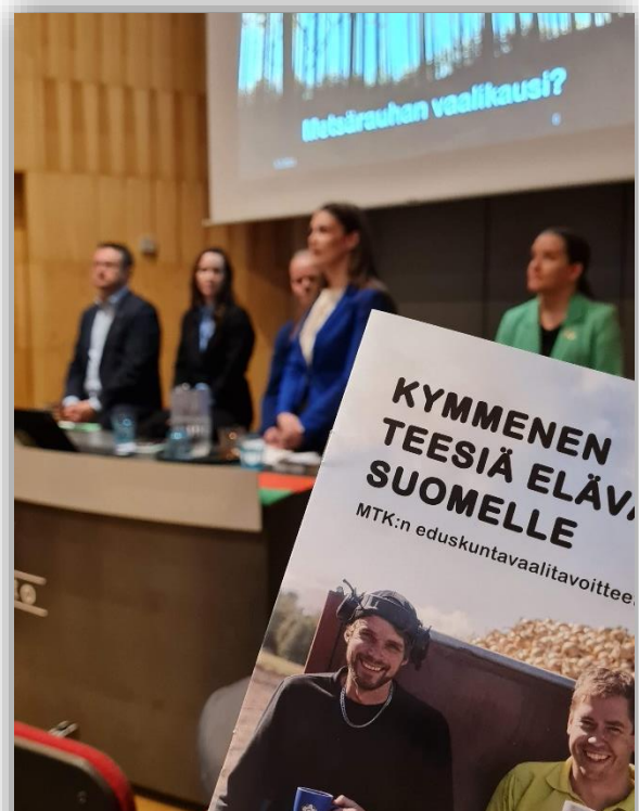
Kuva 13. Metsäteemainen vaalipaneeli Lahdessa

Eduskuntavaalivaikuttaminen käynnistyi "Ääni maalle" -tavoiteohjelman esittelyllä. Nostimme eduskuntavaalit näkyvästi esiin sosiaalisen median kanavissamme ja lähetimme kaikille alueen puolueen