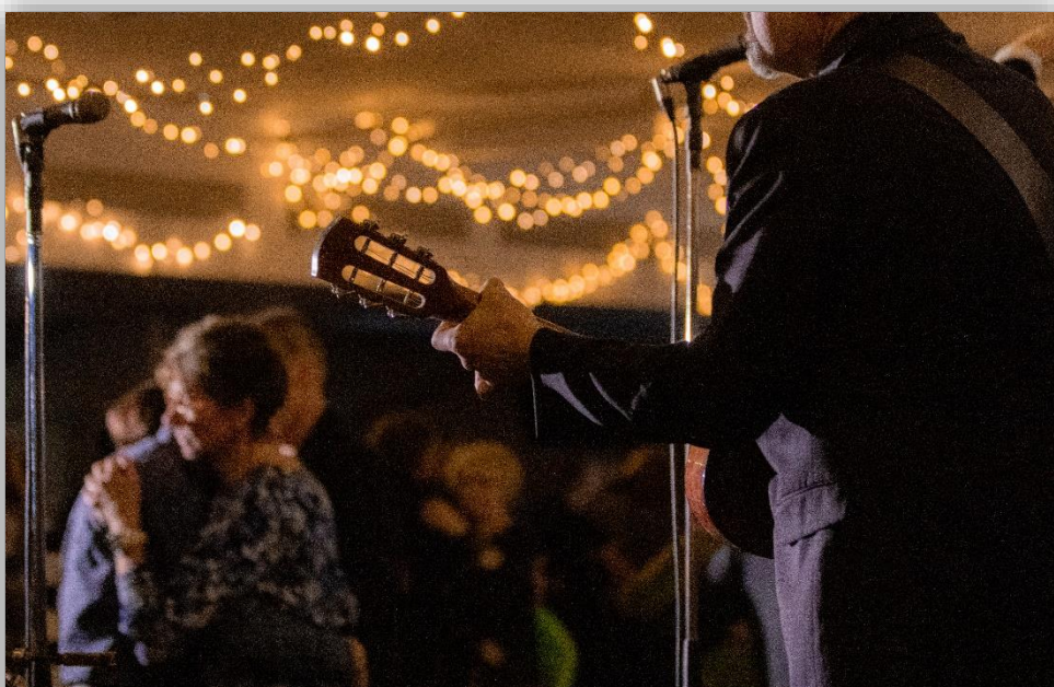
Kuva 1. Tunnelmia Sänkisäpinöiltä.