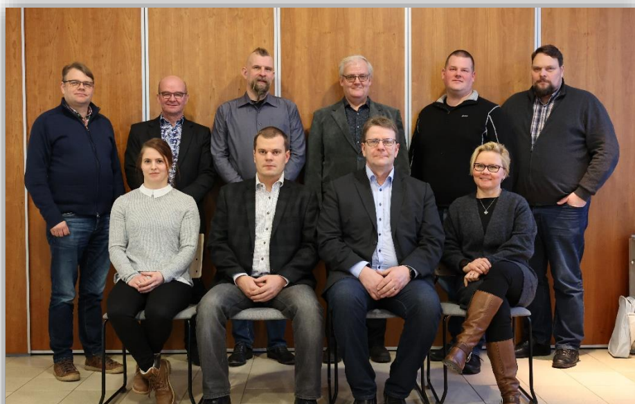
Kuva 14. Liiton johtokunta 2023