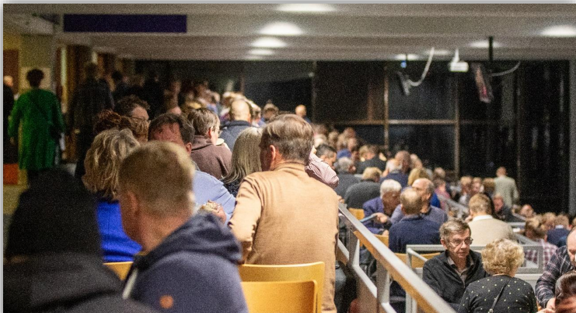
Kuva 8. Tunnelmaa Sänkisäpinöiltä.

Sänkisäpinät-tapahtuma oli liiton suurin viljelijätapahtuma, joka järjestettiin Jokimaan ravikeskuksessa Lahdessa yhteistyössä Päijät-Hämeen viljaklubin kanssa marraskuun alussa. Tapahtuman yhteydessä järjestettiin myös perinteinen sadonkorjuuseminaari, jonka jälkeen tutustuttiin yhteistyökumppanien osastoihin, syötiin päivällistä buffet-pöydästä ja tanssittiin Kyösti Mäkimattilan ja Varjokuvan tahdittamana. Sänkisäpinöillä oli mukana 42 näytteilleasettajaa, jotka olivat tyytyväisiä tapahtuman antiin. Myös tapahtumaan kertyneet lähes 800 osallistujaa osoittivat, että tämän tyyppiselle kokoontumiselle on Päijät-Hämeessä selkeästi tarvetta.