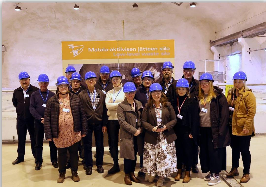
Kuva 16. Johtokunta tutustumassa Olkiluodon ydinvoimalaan