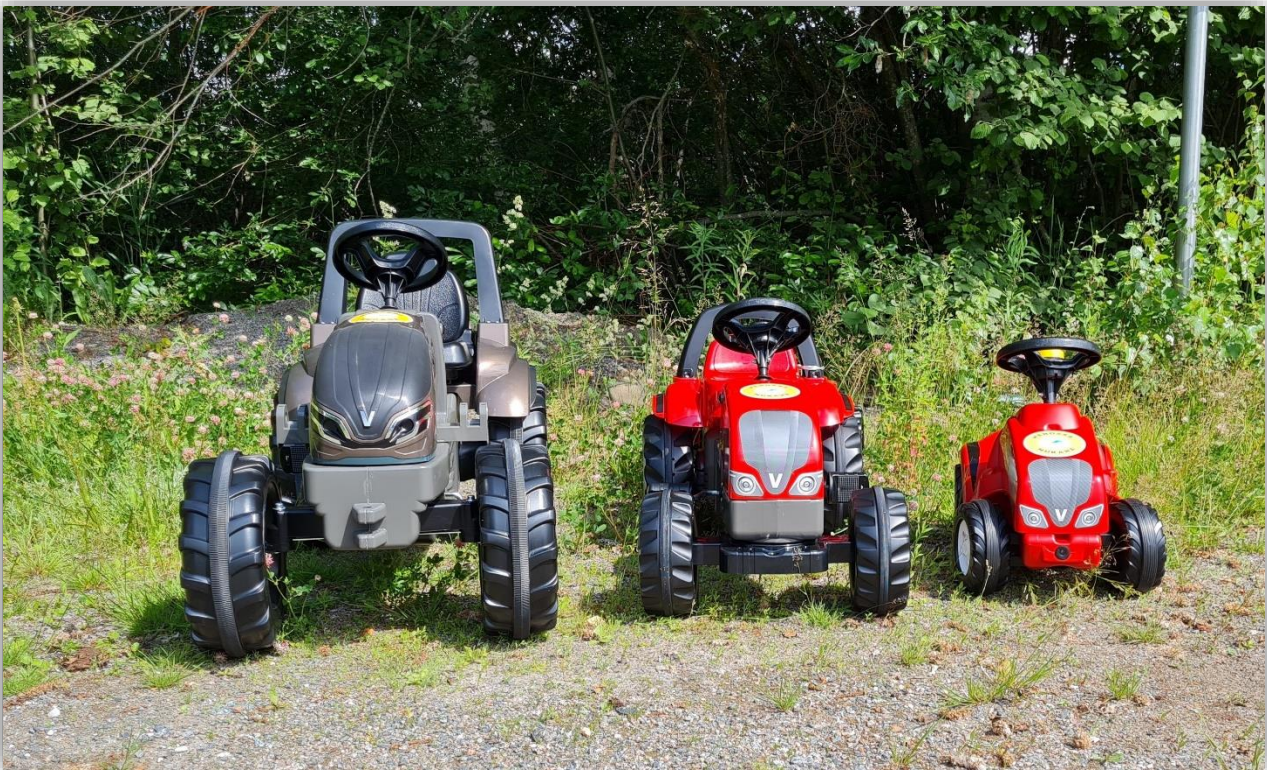
Kuva 2. Vuoden suosituin hankinta kuluttajatyöhön