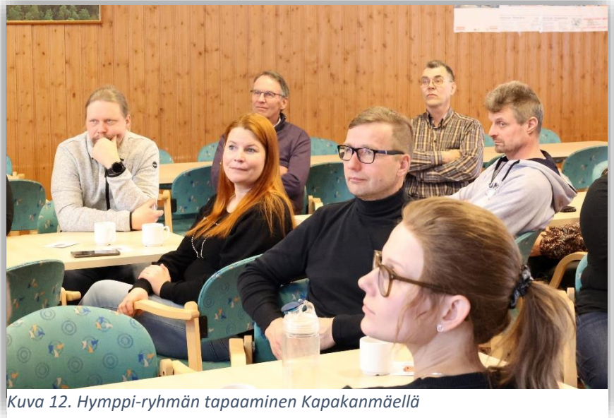
Kuva 12. Hymppi-ryhmän tapaaminen Kapakanmäellä

ryhmässä viesti kulkee yhdistysten ja liiton välillä molempiin suuntiin ilman virallisia kokouksia. Ryhmään kuuluu pääsääntöisesti yksi henkilö jokaisesta MTK-yhdistyksestä, mutta useampia niistä yhdistyksistä, jotka toimivat monen kunnan alueella. Moni ryhmän jäsenistä on myös kuntavaikuttaja, jolloin tiedonsaanti kunnasta on säännönmukaista. Ensimmäisenä toimintavuonnaan ryhmä käsitteli muun muassa aurinkovoiman maanvuokraamiseen, kunnan ympäristömääräyksiin ja kuntien ilmastotavoitteisiin liittyviä asioita. Pääasiallisena viestintäkanavana toimi WhatsApp-ryhmä. Lisäksi Microsoft Teams -alustaa hyödynnettiin tiedostonjakoon ja etäkokousten pitämiseen.