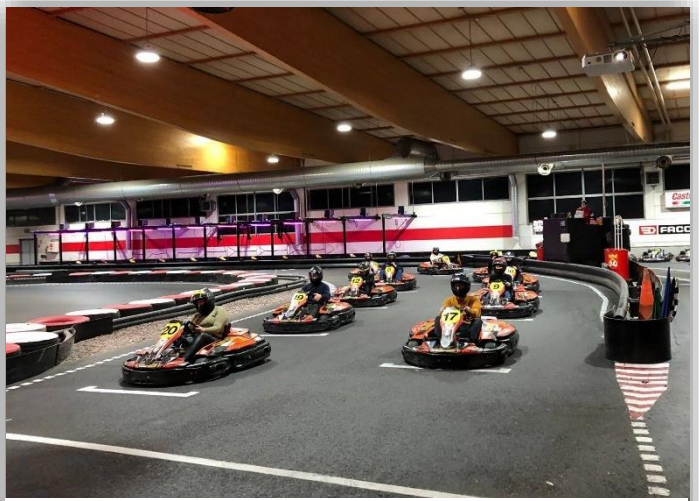
Kuva 10. Maaseutunuorten pikkujoulut kartingia ajaessa Vantaalla

Maaseutunuoret viestivät aktiivisesti jäsenpostissa, sosiaalisen median kanavissa Facebookissa ja Instagramissa sekä etelämanujen WhatsApp-ryhmässä, jossa jäseniä on 120.