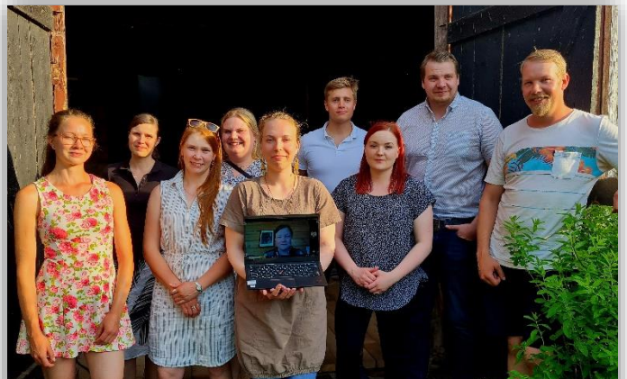
Kuva 9. Nuorten valiokunnan kokous yhdessä Kaakkois-Suomen maaseutunuorten kanssa