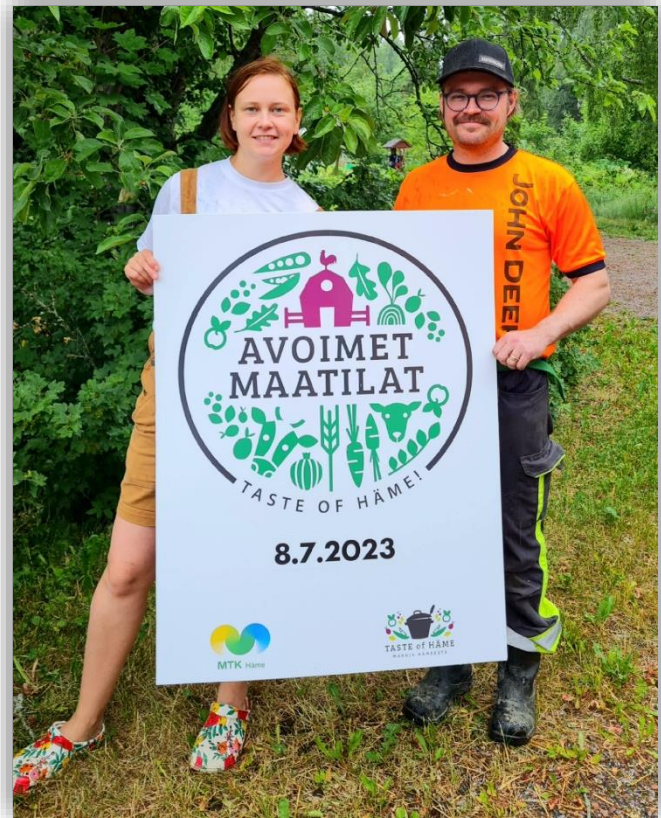
Kuva 4. Avoimet maatilat, Mikkolan tila

Tapahtuma toteutettiin pääosin liiton omin varoin ja siihen osallistuminen oli kohteille maksuton. Markkinointiin ja viestintään saatiin Itikan ja Lihankunnan kuluttajatyöhön myöntämä hankeavustus.