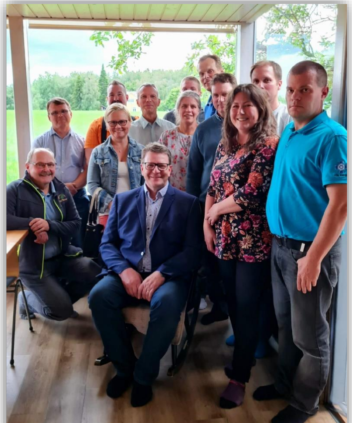
Kuva 7. Lahden alueen yhdistysten kesätreffit Niipalan tilalla

Loppuvuodesta aloitimme yhdistysten puheenjohtajille ja sihteereille kuukausittain järjestettävät tunnin mittaiset aamukahvi-teamsit, joissa käydään läpi ajankohtaisia järjestöasioita, tapahtumia ja koulutuksia. Lisäksi tilaisuuksissa oli alustajia mm. Lähitapiolalta. Yhdistykset ovat ottaneet tilaisuudet hyvin vastaan ja linjoilla on ollut keskimäärin 20 osallistujaa kuukausittain.